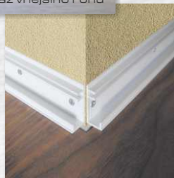
Montáž vnějšího rohu