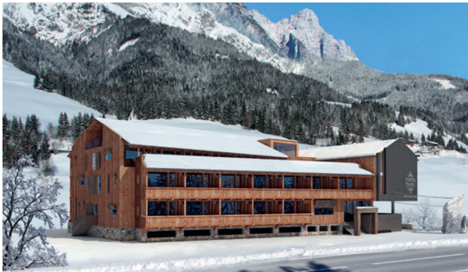
↑ Mama Thresl v rakúskom Leogangu je hotel ideálny pre aktívnych hostí, ktorí majú radi hory, prírodu a čas príjemne strávený s dobrými priateľmi.