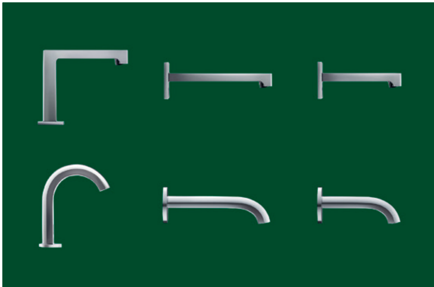
↑ Elektronické batérie Geberit Brenta (hore) a Piave sú k dispozícii v nástennej alebo stojančekovej verzii.