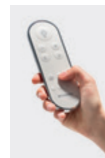
↑ Elegantné, intuitívne a zrozumiteľné diaľkové ovládanie.