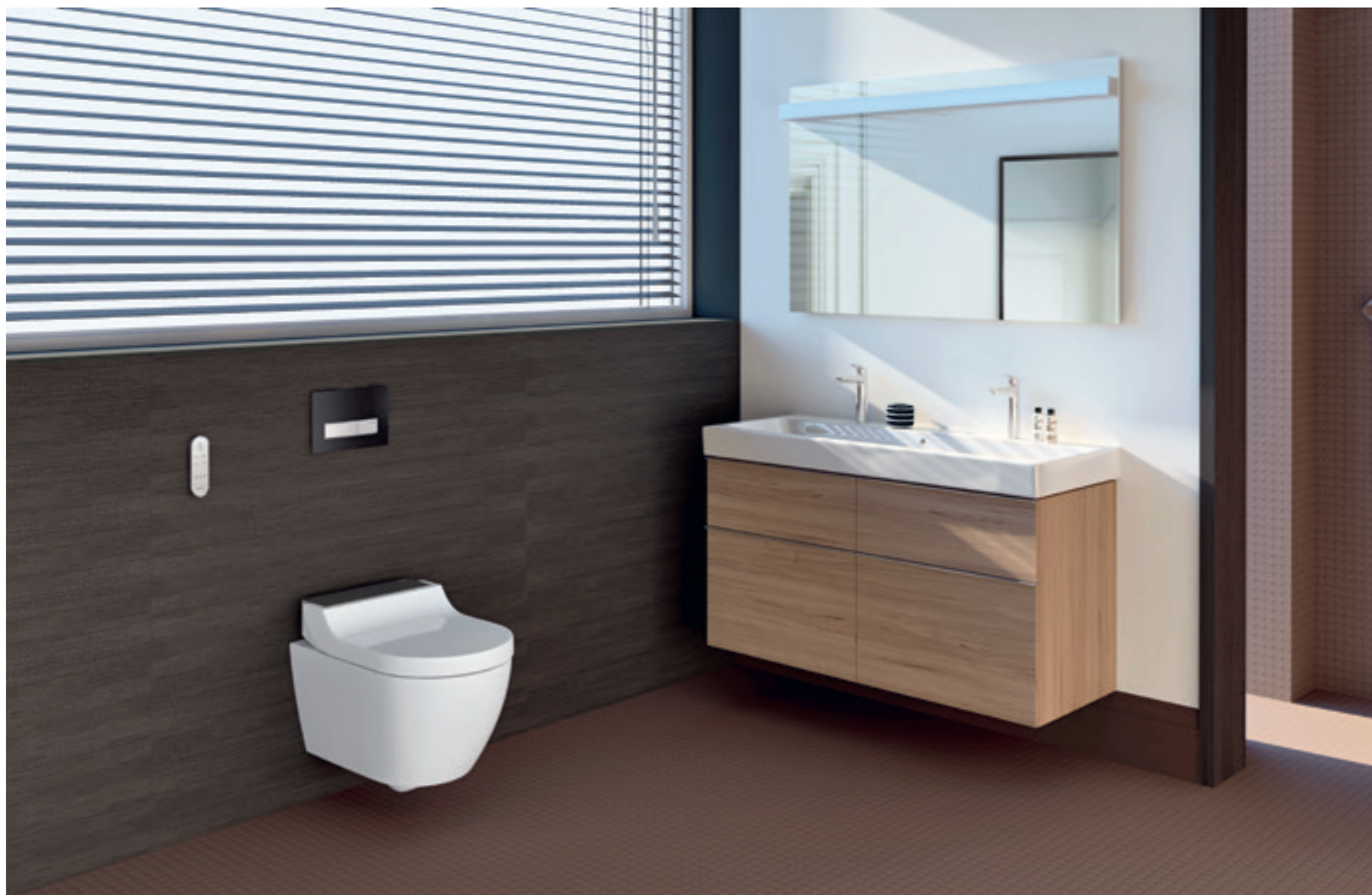
↑ Kompaktná a štíhla toaleta AquaClean Tuma s integrovanou sprchou sa vojde aj do malých kúpeľní a toaliet pre hosti.