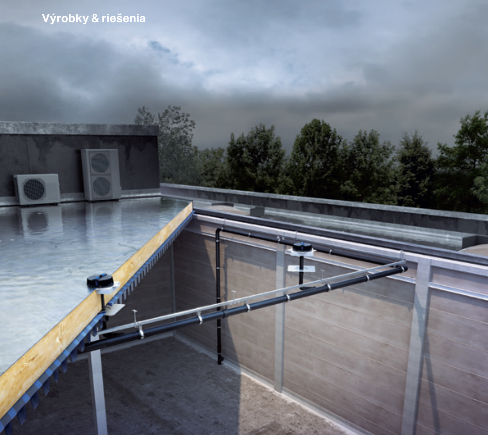
↑ Systém Geberit Pluvia je ideálnym riešením odvodnenia veľkoplošných alebo zložito tvarovaných striech. Zamestnanci firmy Geberit poskytujú projektantom profesionálne technické poradenstvo.

systém pre profesionálnu montáž rúr Geberit PE. Vzdialenosť závesov môže dosahovať až 2,5 metra. Systém predstavuje len veľmi malú záťaž, a preto je ideálny pre strechy s ľahkou konštrukciou.