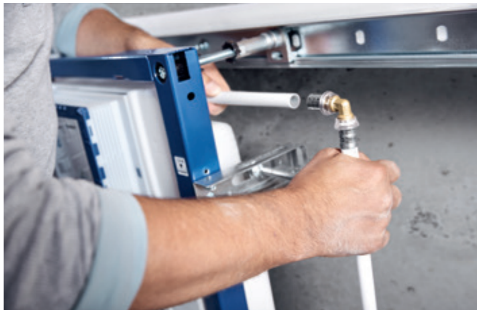
↑ Zasunutie mosadznej tvarovky do rúry nevyžaduje žiadne väčšie úsilie.

Nový potrubný systém Geberit Volex kombinuje dve dobre zabehnuté a osvedčené technológie: viacvrstvomé rúry a lisované spoje. Už desiatky rokov je táto kombinácia zárukou efektívnych, spoľahlivých a cenovo výhodných realizácií potrubných rozvodov. Geberit Volex prichádza s množstvom dômyselných vylepšení, ktoré ešte viac uľahčujú montážne práce na stavbe a rozširujú možnosti využitia.