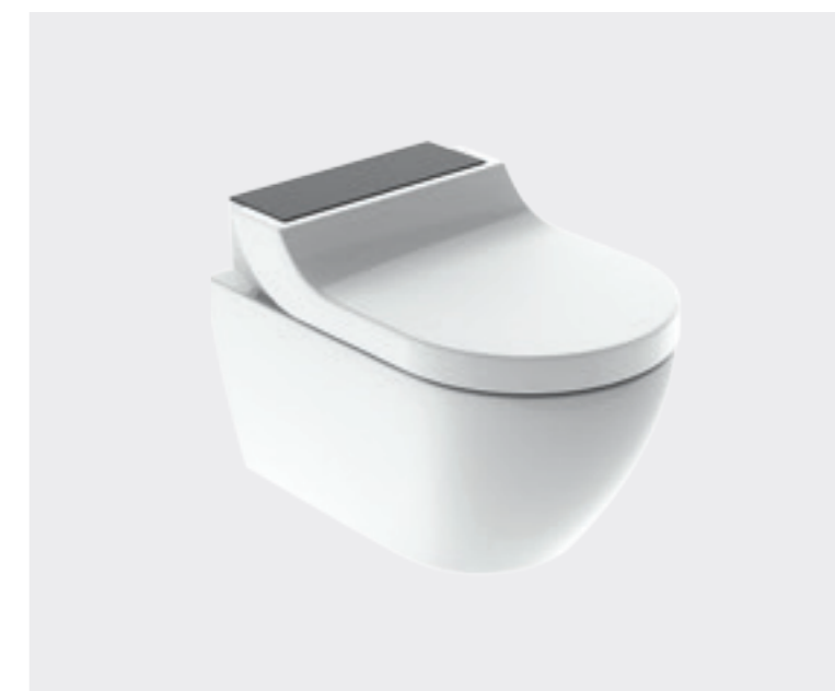
↑ Dizajnový kryt je v ponuke v rôznych farbách a materiáloch.

AquaClean Tuma, najnovší model z radu toaliet s integrovanou sprchou Geberit, prekvapuje premysleným produktovým konceptom a jednoduchým, elegantným dizajnom. Je k dispozícii ako kompletne riešenie s WC misou bez okrajov a tiež ako sedadlo určené na montáž na už nainštalovanú WC misu.