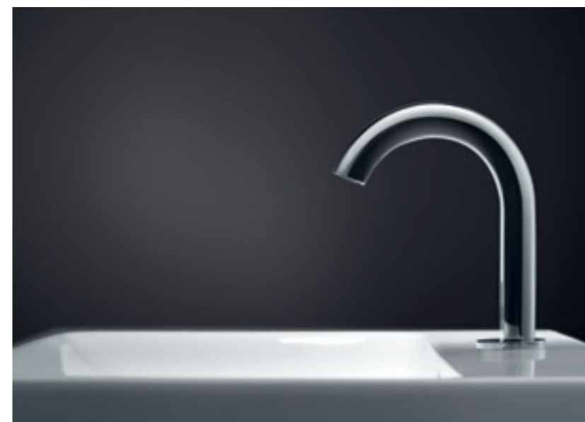
↑ Sortiment umývadlových batérií Geberit obsahuje tiež stojančekové modely s vysokým, štíhlym telom, ktoré poskytujú pri umývaní rúk optimálnu ergonómiu a hygienu. Na fotografii je stojančeková batéria Geberit Piave.