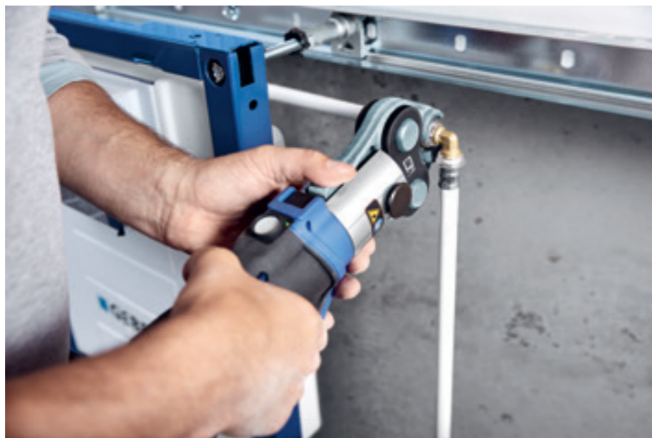
↑ Lisovací nástroj Geberit zapadá presne do profilu tvarovky a zaručuje bezchybné vykonanie inštalačnej práce.

Rúry Geberit Volex sa skladajú z vnútornej vrstvy z PE-RT, hliníkovej rúrky a ochrannéj PE-RT vrstvy na vonkajšej strane. Jednotlivé vrstvy držia spolu vďaka špeciálnemu spojivu. Vnútorný povrch je dokonale odolný voči korózii a je potravinársky bezpečný. Hliníková vrstva v strede poskytuje rúre tvarovú stálosť a zároveň umožňuje jej ohýbanie a tvorí antidifúziu kyslíkovej bariéry. Biele vonkajšie opláštenie chráni hliníkové jadro pred koróziou a pred mechanickým poškodením. Mimoriadne vysoká odolnosť viacvrstvomých rúr voči tlaku presahuje štandardnú skúšobnú hodnotu 15 bar. Rúry sú vhodné na rozvody pitnej vody v budovách a tiež na podlahové vykurovanie a pripojenie vykurovacích telies. Vďaka bielemu oplášteniu rúr a nenápadným tvarovkám sa systém Geberit Volex veľmi dobre hodí aj na rekonštrukcie, kde je treba potrubné rozvody inštalovať na omietku.