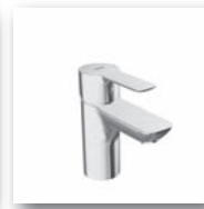
Einloch-Einhandarmatur XS 0607 2203 verchromt