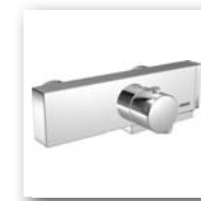
HANSACUBE- Wannen-Thermostat 5835 2101 verchromt