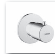
Unterputzventil / Mehrwegeumstellung 0628 9105 verchromt, absperierbar, zzgl. UP-Körper-Ventil, 0225 0100 (DN 15) oder 0226 0100 (DN 20), zzgl. UP-Körper- Mehrwegeumstellung, 0295 0100 (DN 15 inkl. Absperrung)