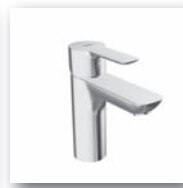
Einloch-Einhandarmatur 0613 1103 verchromt ♯