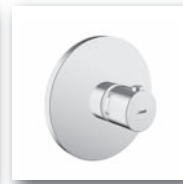
Unterputz-Thermostat 0665 9105 verchromt, ohne Absperrung, zzgl. 0805 0290 G 3/4 " (DN 20) UP-Grundeinheit