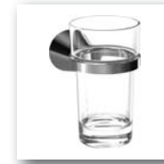
Glashalter 5129 0970 verchromt Kristallglas, klar