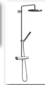
HANSATEMPRA STYLE Brausen-Thermostat mit angeschlossenem Duschsystem 5842 9103 verchromt