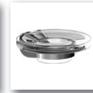
Seifenschale 5127 0970 verchromt Kristallglas, klar