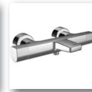
HANSATEMPRA STYLE Wannen-Thermostat 5844 2101 verchromt