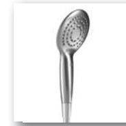
HANSAPUREJET 0431 0200 verchromt, 1-strahlig 0432 0200 verchromt, 2-strahlig