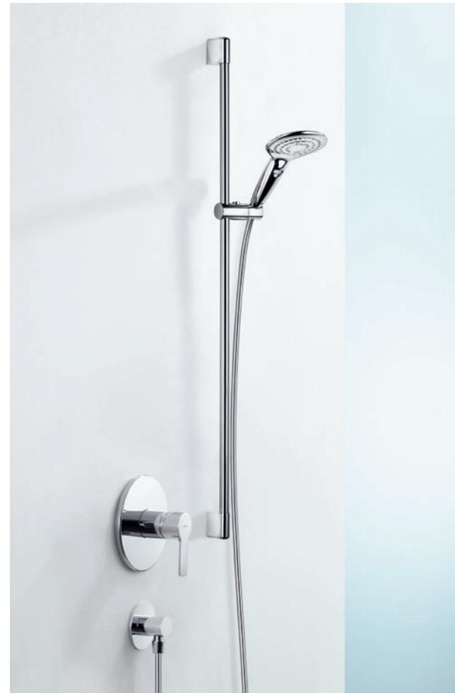
Komfortabel und schön: eine HANSALIGNA-Aufputzarmatur für Duschsysteme, hier in Kombination mit einem HANSAJET-Duschsystem (großes Bild rechts).