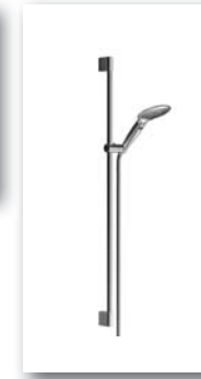
HANSAPUREJET-Brauseset 0456 0210 verchromt, 900 mm, Handbrause 1-strahlig, Schlauch 1.750 mm 0456 0220 verchromt, 900 mm, Handbrause 2-strahlig, Schlauch 1.750 mm