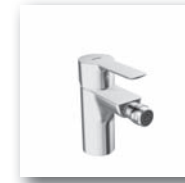
Einloch-Einhandarmatur 0606 3203 verchromt