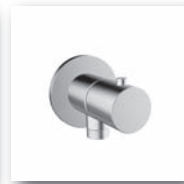
Wandanschlussbogen 5157 0173 verchromt, mit Absperrventil