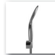
HANSAPUREJET-Set 0401 0210 verchromt, Handbrause 1-strahlig, Wandhalter, Schlauch 1.250 mm 0401 0220 verchromt, Handbrause 2-strahlig, Wandhalter, Schlauch 1.250 mm