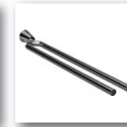
Handtuchhalter 5123 0970 verchromt 2-teilig