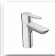
Einloch-Einhandarmatur 0608 2203 verchromt ohne Bohrung