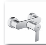
Aufputz-Einhandarmatur 0667 0103 verchromt