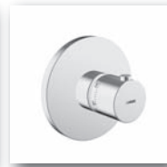
Unterputz-Thermostat 4866 9501 verchromt, ohne Absperrung, zzgl. 4000 0000 *UP-Grundeinheit