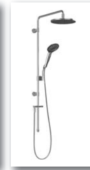
HANSAJET-Duschsystem zum direkten Anschluss an Aufputz-Einhebel- oder Thermostat-Brausearmatur, mit HANSARAIN- Kopfbrause und HANSAPUREJET- Handbrause 5167 0200 verchromt