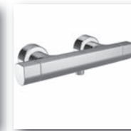
HANSATEMPRA STYLE Brausen-Thermostat 5841 0101 verchromt