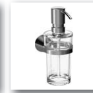
Seifenspender 5130 0970 verchromt Kristallglas, klar