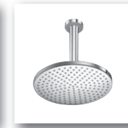
HANSARAIN-Kopfbrause mit Ganzmetallgehäuse, Deckenverbindungsrohr, kürzbar auf 78 bis 198 mm 0419 0100 verchromt