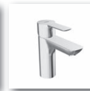
Einloch-Einhandarmatur 0609 2203 verchromt