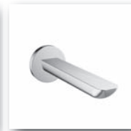
Wanneneinlauf 0682 2102 verchromt