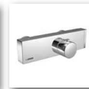
HANSACUBE- Brausen-Thermostat 5833 0101 verchromt