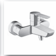
Aufputz-Einhandarmatur 0674 2103 verchromt, mit Umstellung