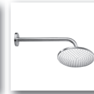
HANSARAIN-Kopfbrause mit Ganzmetallgehäuse, Brausearm, 400 mm 0418 0100 verchromt