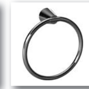
Handtuchring 5131 0970 verchromt