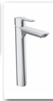
Einloch-Einhandarmatur 0603 2203 verchromt