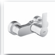
Aufputz-Einhandarmatur für Duschsystem 0667 9103 verchromt